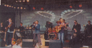
Die Live-Band ALMA sorgt in den Ausstellungshallen des Autohauses THIEL für spanisches Flair.